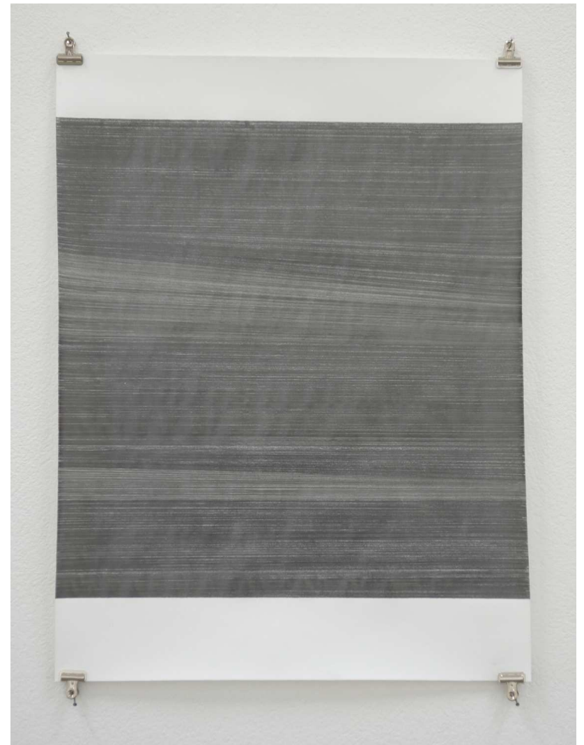
solomon sea II graphite on paper, 60 x 45 cm, 2012