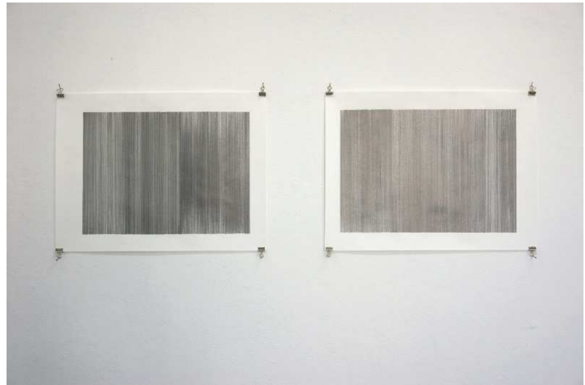
solomon sea IV and V graphite on paper, each 60 x 45 cm, 2012