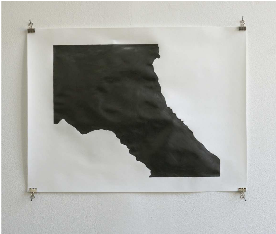
solomon sea I graphite on paper, 60 x 45 cm, 2012